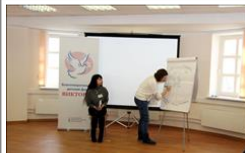
Представление случая Карты сети социальных контактов помогли быстро и