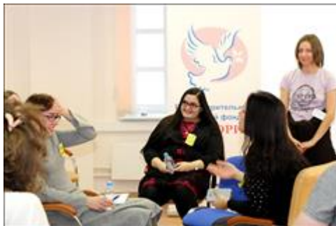
Практическая работа на семинаре "Сетевые встречи" Время семинара максимально использовалось для практики - ролевых игр, моделирующих сетевые встречи.