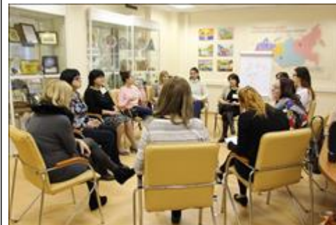
Практическая работа на семинаре "Сетевые встречи" Двое ведущих разделили участников на две подгруппы в разных помещениях, чтобы иметь возможность уделить внимание каждому.