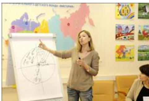
Работа с картой сети социальных контактов