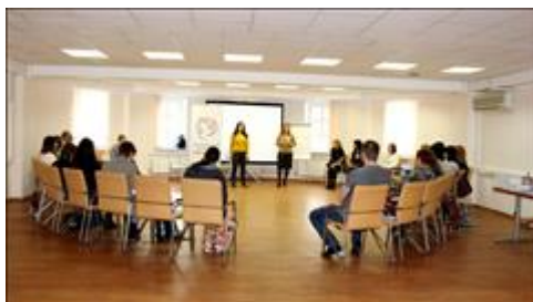
Открытие семинара "Сетевые встречи" Открытие семинара - важный момент, чтобы познакомить участников дистанционного курса друг с другом и с ведущими.